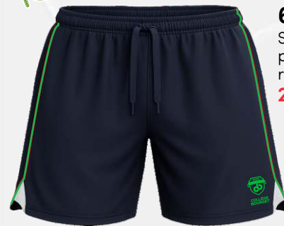
6020 Short long en polyester de fibre recyclée 27 00 $