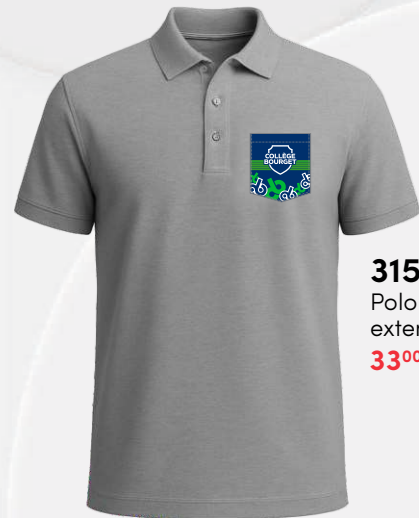
3157 Polo coton extensible 33 00 $