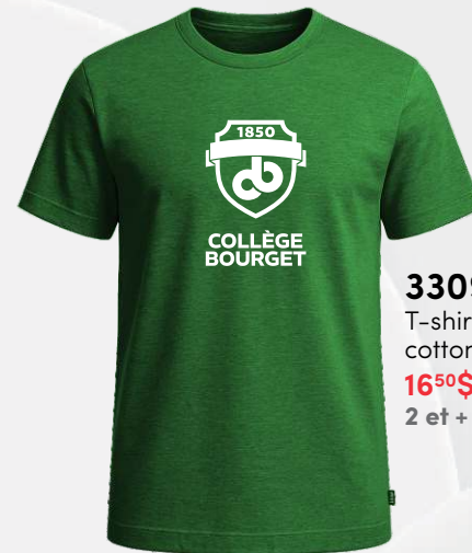
3309 T-shirt en coton 16 50 $ 2 et + : 15 00 $ / unité