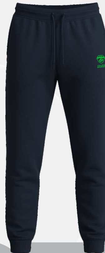
2306 Pantalon molleton léger à chevilles élastiquées 35 00 $