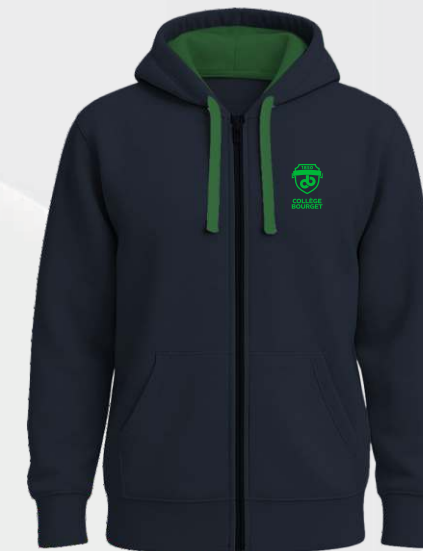
3406C2 Veste ouatée zippée à capuchon 45 00 $ Peut être porter en classe