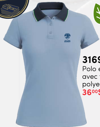
3169 Polo en coton piqué avec fibres de polyester recyclées 36 00 $