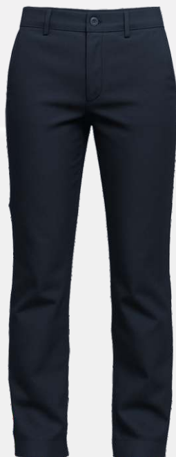
2208 Pantalon ajustable en toile 52 00 $