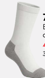
7203 Bas d'exercice au molet 4 95 $ 3 et + : 4 50 $ / unité