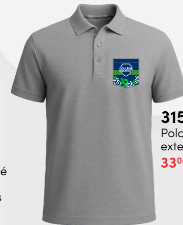
3157 Polo coton extensible 33 00 $