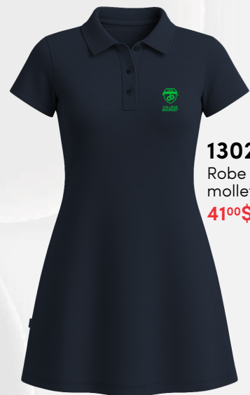
1302 Robe tennis en molleton léger 41 00 $