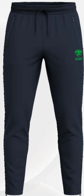
2370 Pantalon en nylon, zips aux chevilles 49 50 $