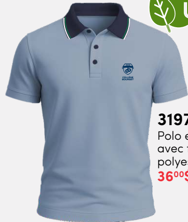
3197 Polo en coton piqué avec fibres de polyester recyclées 36 00 $