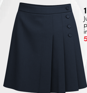
1227 Jupe tissée à panneaux cuissard intégré 52 00 $