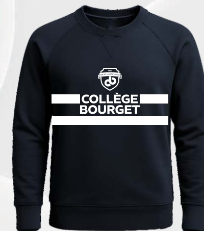
7710 Chandail raglan col rond en ouaté 45 00 $