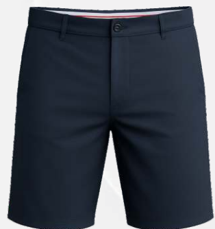
6102 Bermuda de golf en toile 44 50 $ Taille ajustable ENF & JR