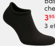
7205 Bas d'exercice cheville 3 95 $ 3 et + : 3 50 $ / unité