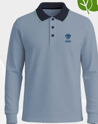
3194 Polo en coton piqué avec fibres de polyester recyclées 37 00 $