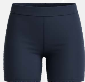
6040 Cuissard en nylon elasthan 15 00 $ Porter sous la robe