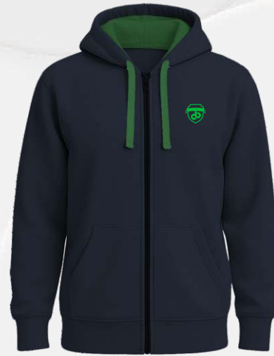
3406C2 Veste ouatée zippée à capuchon 45 00 $ Peut être porter en classe