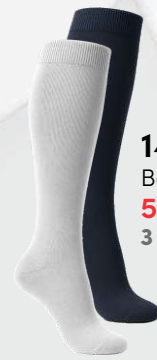
1404 Bas 3/4 5 00 $ 3 et + : 4 50 $ / unité