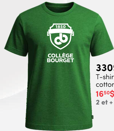
3309 T-shirt en cotton 16 50 $ 2 et + : 15 00 $ / unité