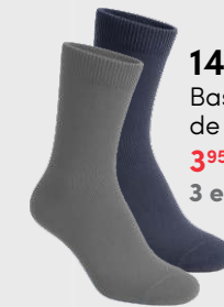
1401 Bas de ville 3 95 $ 3 et + : 3 50 $ / unité