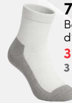
7201 Bas d'exercice 3 95 $ 3 et + : 3 50 $ / unité