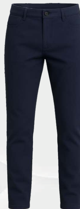
2117 Pantalon ajusté en toile 56 00 $ Taille ajustable ENF & JR