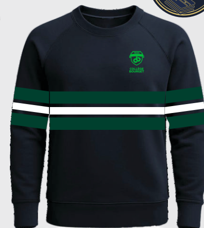
5440 Pull col rond ample en tricot 60 00 $